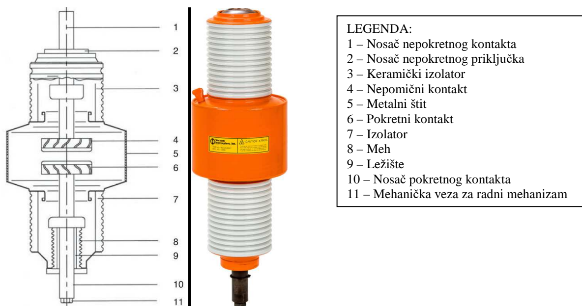
Slika 1 – Vakuumska komora

brzo kondenzuju na površini kontakata vakuumske komore sa ishodom brze obnove dielektrične čvrstoće. Vakuumska komora ima jedan nepomični i jedan pomični kontakt. Na slici 1 je dat prikaz vakuumske komore.