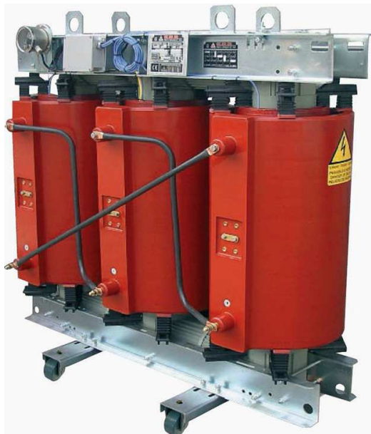
Slika 3 – Suvi transformator

Već dugi niz godina se proizvode suvi transformatori. Dugogodišnje iskustvo je donelo unapređenje u konstrukciji, tehnologiji izrade i tehnologiji obrade primenjenih materijala [4]. U elektrodistributivnoj delatnosti se uglavnom koriste u specijalnim primenama na mestima sa posebnim zahtevima što se tiče protivpožarne zaštite.