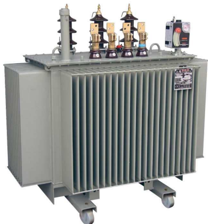
Slika 4 – Izvedba transformatora sa biljnim uljem

Sa sve većim zahtevima za zaštitu životne sredine i upotrebe materijala koji ne zagađuju ili mogu da zagade životnu sredinu u manjoj meri uočena je mogućnost korišćenja biljnih ulja kao gorivo kod motornih vozila, ali i kao izolaciono sredstvo u transformatorima.